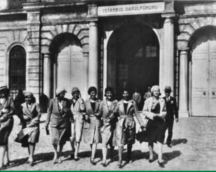
Darülfünun önünde 1921-1925

Kadın Eserleri Kütüphanesi Süreyya Ağaoğlu Özel Arşivi